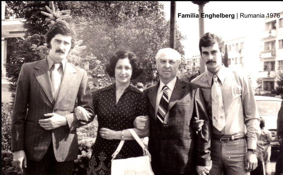
Familia Enghelberg | Rumania 1976

Entre 1933 y 1945, Europa estaba bajo el dominio del mal: Alemania Nazi. Durante este periodo, las negras nubes de una guerra total, aportaron un sin número de tragedias individuales, que moldearan varias generaciones, que fueron asesinadas y maltratadas por el maligno genio de Adolfo Hitler y sus seguidores.